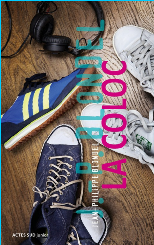
La colocation , Actes Sud Junior, 2015

Les parents de Romain ont hérité d'un grand appartement situé dans la ville de son lycée. Ils hésitent à le vendre ou le louer. L'adolescent y voit un coup de pouce du destin : et si c'est lui qui l'habitait, moyen d'en finir avec les longs trajets en car entre le domicile familial et son bahut ? ! Les parents se laissent convaincre et il faut alors trouver deux autres colocataires. Une année pleine de changements s'ouvre pour Romain, entre émancipation, amitié et contraintes de la vie en communauté.